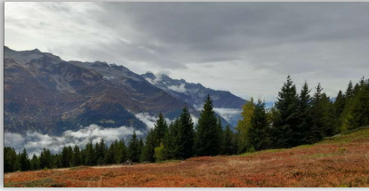
Le massif de La Lauzière vu du Grand Arc