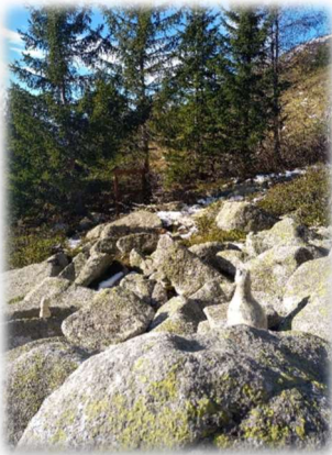
Sculpture de lagopède dans son habitat naturel

Le Syndicat Mixte de la Lauzière organise chaque année plusieurs « sorties nature » qui sont financées par Natura2000 et qui ont pour objectif de sensibiliser à l'environnement.