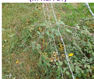
ENRACINEMENT DES RONCES