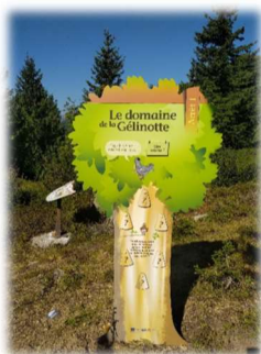
Sentier « TEQUITOI »

Le sentier « Téquitoi » sur les galliformes de Montagne, perdrix bartavelles, gélinottes des bois, lagopèdes et tétras lyres a été installé cet été à saint François-Longchamp, aux Pérelles.